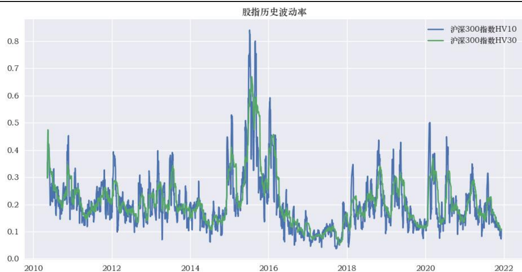
图表 3：沪深 300 股指历史波动率