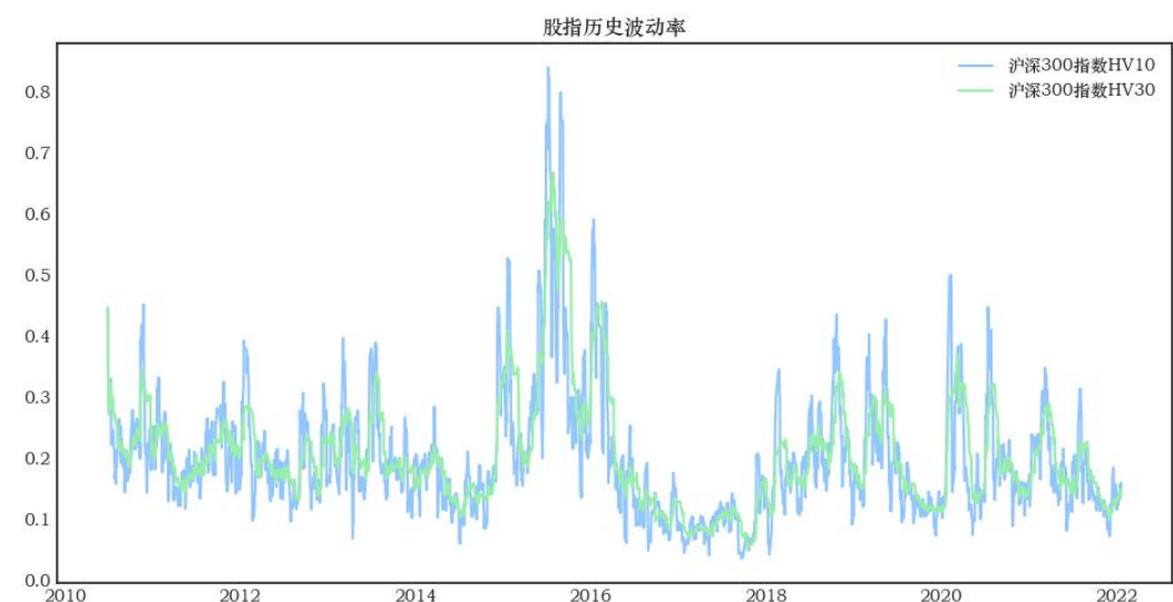
图表 3：沪深 300 股指历史波动率