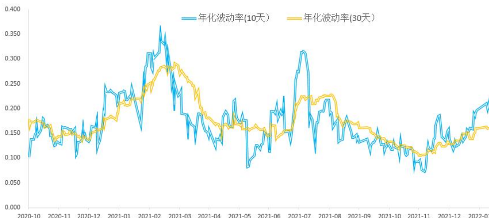
图表 3：沪深 300 股指历史波动率